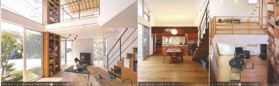
西と南へつながる開放的な半屋外空間【イメージ写真】