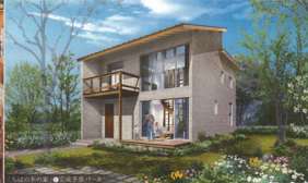
ちばの木の家。【イメージ写真】